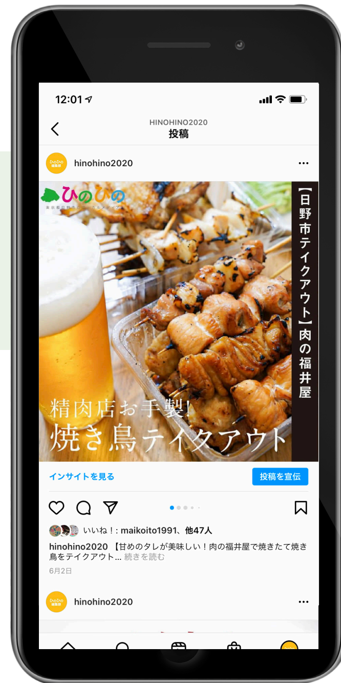
画像: SNSバナー作成の例