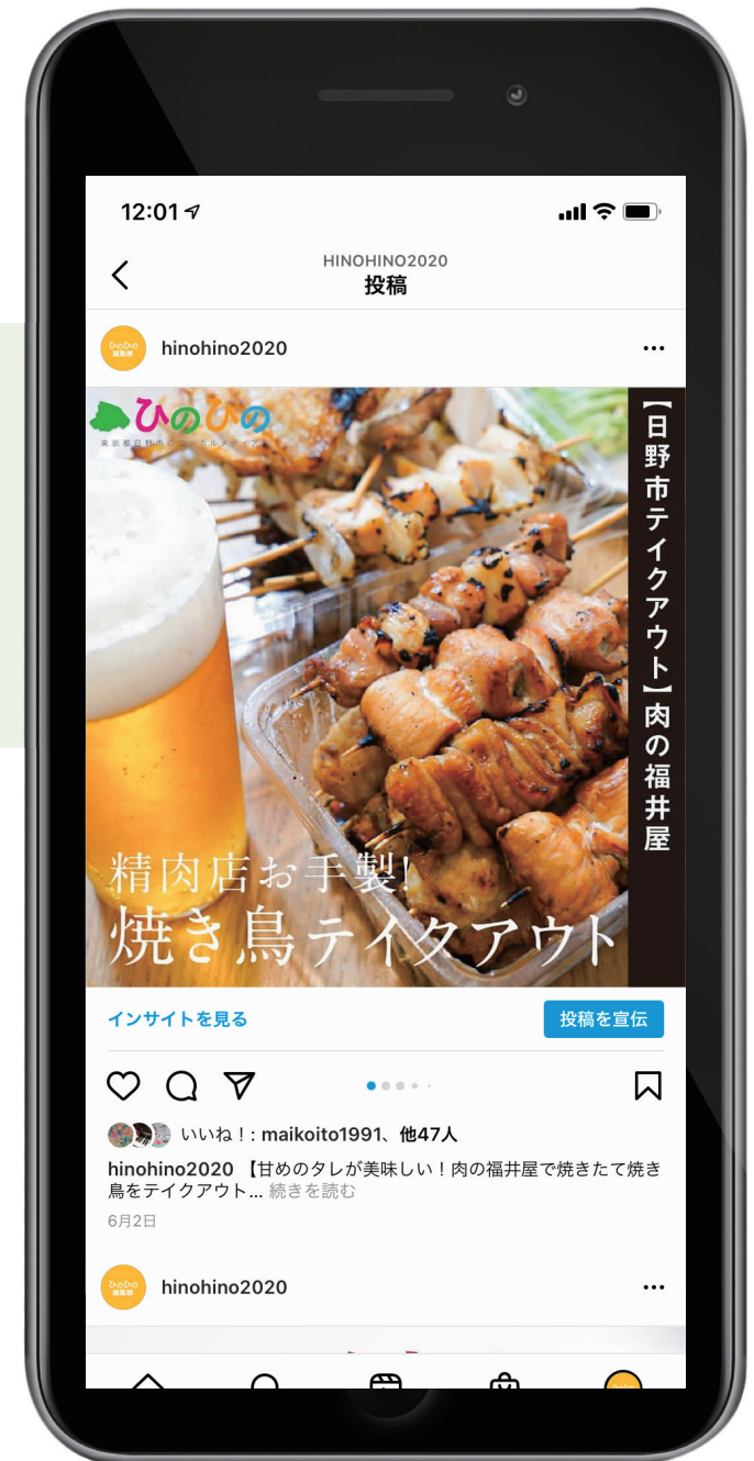
画像: SNSバナー作成の例